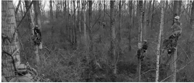
Sterrebos, januari 2022

hebben zich daar geïnstalleerd in hangmatten. De actie is georganiseerd om het bos te beschermen tegen de geplande kap door autofabriek VDL Nedcar. Voor meer informatie check het artikel op pagina 9 in deze RUMOER.