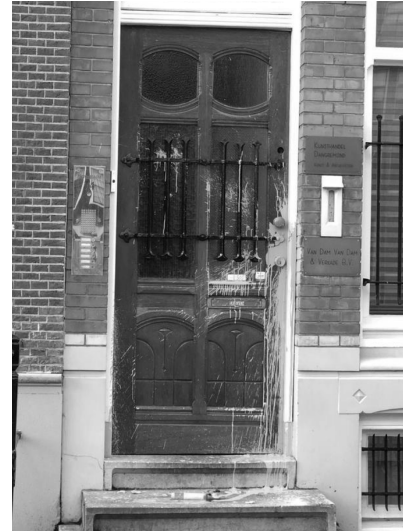
Amsterdam, januari 2022

Terwijl zij hun gore retoriek aan het verspreiden waren op een publieke bijeenkomst, heeft een groep vermomden overdag wat verf gooid op hun hoofdkantoor.