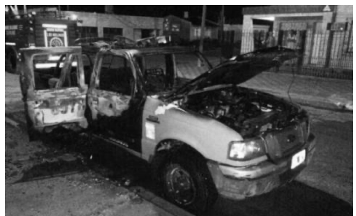
Buenos Aires, Argentina, April 2022

fend and spread one's subversive ideas without falling into paranoia, while finding ways to deepen affinities far from any electronic device, remains a challenge." Read more on our safety: earsandeyes.noblogs.org , www.csrc.link/