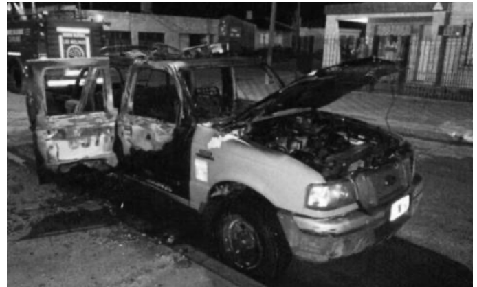
Buenos Aires, Argentinië, april 2022

Een patrouillewagen van de politie van Buenos Aires werd in de fik gezet, op de hoek van politiestation nummer 37 [...]. Anarchistische cel Santiago Maldonado