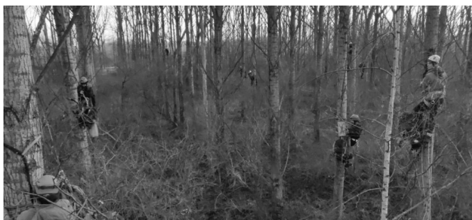
Sterrebos, January 2022

Early this morning the Sterrebos near Born (Limburg) was occupied. People went up in the trees and installed their selves in hammocks. The action was organized to protect the forest from the planned logging by car manufacturer VDL Nedcar. Update February 8th: after some days they managed to evict. For more information check the article on page 9 of this RUMOER.