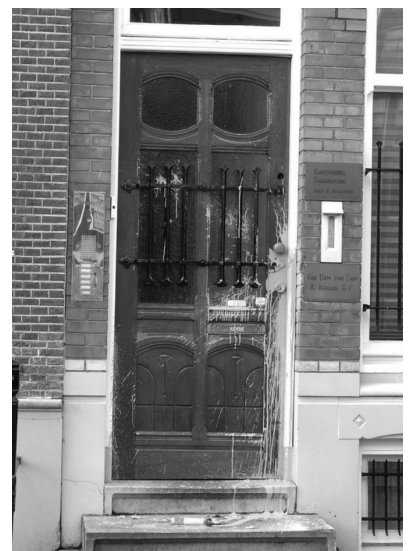
Amsterdam, January 2022

While FvD was sharing their disgusting rhetoric at a public event, a group of hooded people threw paint at their headquarters in broad daylight.